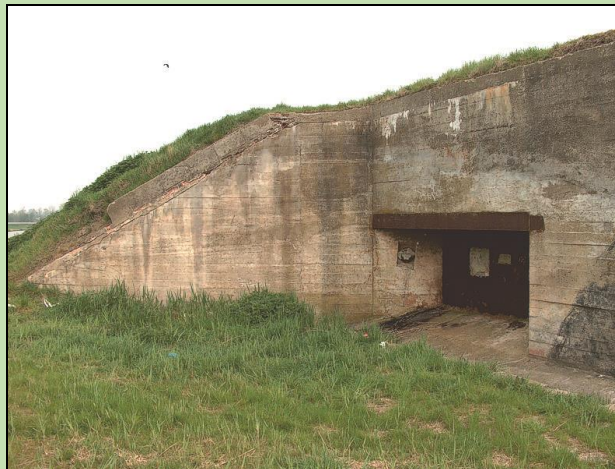
Mitrailleurbunker nr. 3 toont de pantserplaat waar achter de mitrailleur was opgesteld.

Vlissingen had gedurende de Tweede Wereldoorlog een belangrijke positie en werd krachtig versterkt in de Atlantikwall opgenomen. Om de stad tegen aanvallen in de rug te beschermen, werd er aan de landzijde een verdedigingslinie aangelegd. Dit Landfront bestond uit een kilometerslange tankgracht met daarachter tientallen kazematten voor mitrailleur of antitankgeschut.