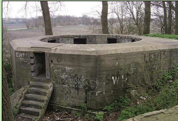
Open luchtdoelopstelling voor een 10,5 cm kanon in een dunstalen koepel, die na de oorlog verwijderd is.

De batterij is nu een monument voor de luchtoorlog boven Vlissingen, die op de grond zoveel slachtoffers gekost heeft. Ze laat tevens zien dat cultuurhistorie, natuurwaarden en recreatie hand in hand kunnen gaan.