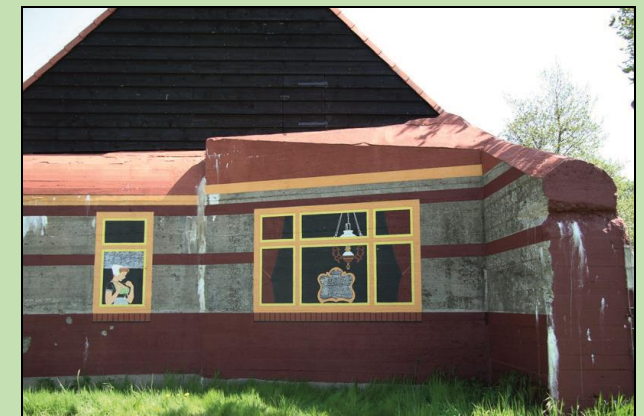
De bunker van het type 621 was door de Duitsers als een huis gecamoufleerd.

De doorgang in de Nieuwe Vlissingeweg en de trambaan was van zodanig belang dat er een antitankkanon kon worden opgesteld. De garage hiervoor is bunker nr. 10. Het personeel vond een beschermd onderkomen in de personeelsbunker type 621.(nr. 8)